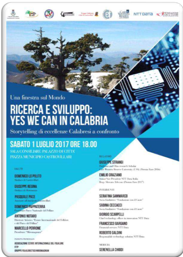
Sabato Il 1 Luglio la fondazione con il cuore a Castrovillari per il Convegno Ricerca e Sviluppo «Eccellenze Calabresi»