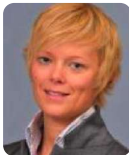
PROF. NICOLE STEINMETZ Case Comprehensive Cancer Center, Cleveland USA