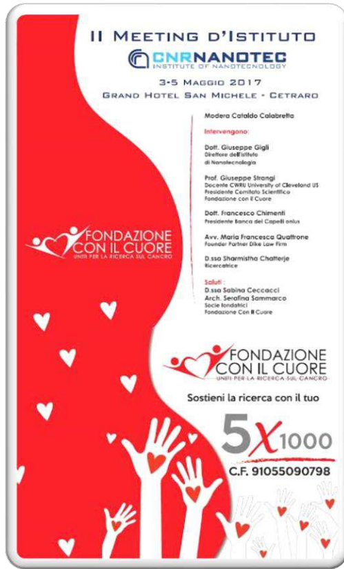
CAMPAGNA RACCOLTA FONDI 5X1000